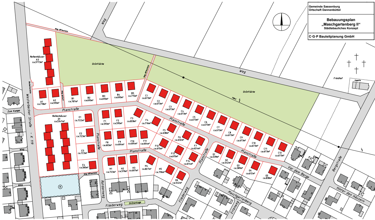
Grafik: Munte Immobilien